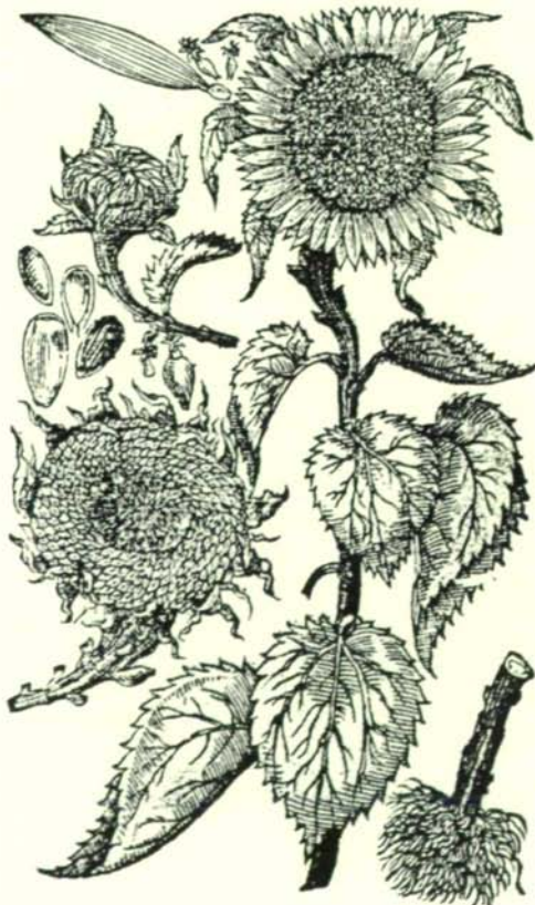
Groß Indianisch Flos Solis Peruvianus. Sonnenblum.