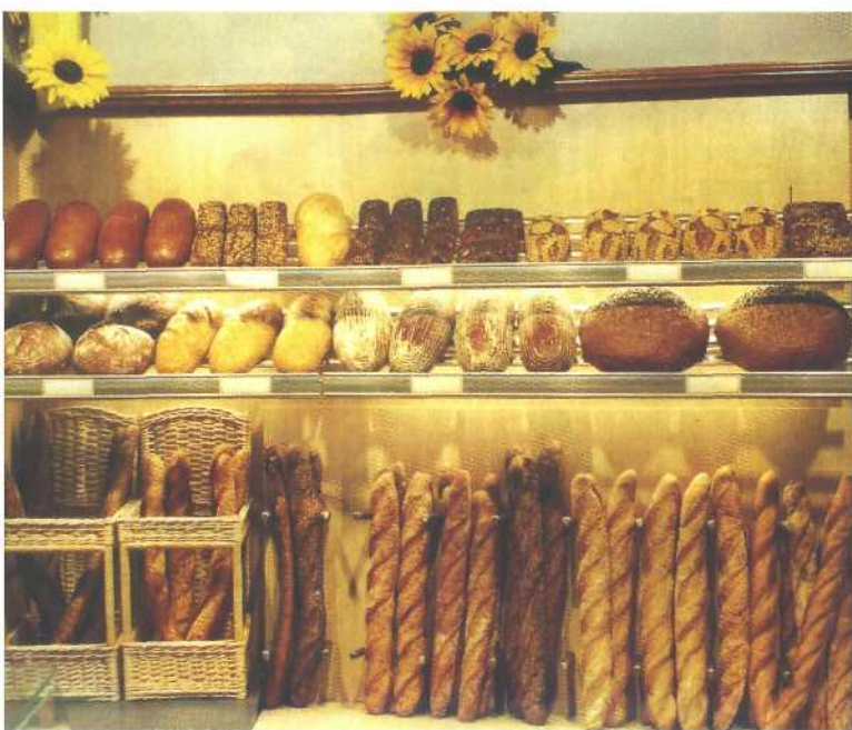
Für die verschiedensten Rezepturen finden sich speziell entwickelte Backmittel und Premixes am Markt. Der Bäcker hat die Qual der Wahl, er muss die Produkte der Hersteller entsprechend seinem Sortiment klug zusammenstellen.

Das Lecithinmolekül hat also ein lipophiles Ende und ein hydrophiles Ende und ist eben dadurch bedingt ein idealer Emulgator. Es wurden nun auch sehr viele künstliche Emulgatoren entwickelt. Künstlich heißt in diesem Fall, dass aus einem Rohstoff durch eine oder mehrere chemische Reaktionen ein Verbindung gebildet wird, die ein lipophiles und ein hydrophiles Ende hat und genauso wie das Lecithin in der Lage ist, fette und wässrige Zutaten zu verbinden. Zum Einsatz kommt hier vor allem eine Gruppe von Emulgatoren mit der Abkürzung DAWE (Diacetylweinsäureester mit Mono- und Diglyceriden), auf englisch DATEM (Diacetyl tartaric acid esters of mono- and diglycerides). Diese Emulgatoren müssen bei verpackten Backwaren jedenfalls als Zusatzstoffe angegeben werden, mit Zusatzstoff Nr. E472e. Weitere ähnliche ►