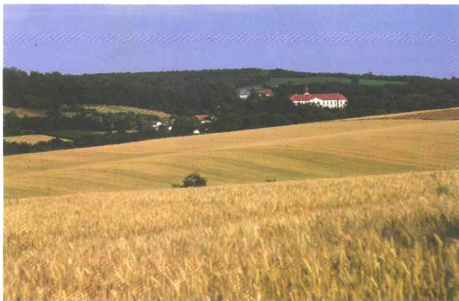
Weizenfeld vor der Ernte im Weinviertel: Die kohlenhydratreichen Getreide sind die Grundlage des Ackerbaus und der Brotkultur in Österreich.

Die nicht verwertbaren Kohlenhydrate finden sich bei den Ballaststoffen wieder. Der Name Ballaststoffe ist in einer Zeit entstanden, als man gewisse Verbindungen in der Nahrung als überflüssig ansah. Zu den Ballaststoffen gehört z. B. die Cellulose in der Schale des Getreidekornes. In den Anfängen der Biochemie gab es das Problem, dass die Analytik noch nicht feststellen konnte, was genau verwertbar war und man behalf sich zunächst damit, einen einfachen Test auf „Rohfasergehalt“ durchzuführen. Dabei unterzog man den „Speisebrei“ einem einfachen Aufschluss durch Salzsäure unter Bedingungen, die auch im Magen herrschen. Was in der Salzsäure nicht in Lösung ging wurde als „Rohfaser“ bezeichnet. Inzwischen ist es jedoch möglich geworden, den Verdauungsvorgang noch besser nachzubilden unter zusätzlicher Verwendung der Verdauungsenzyme. Es kann nun genau aufgeschlüsselt werden in unlösliche Ballaststoffe und in lösliche Ballaststoffe, die man mit der alten Methodik nicht erfassen konnte. Chemisch sind besonders die löslichen Ballaststoffe zu einem großen Teil Koh-