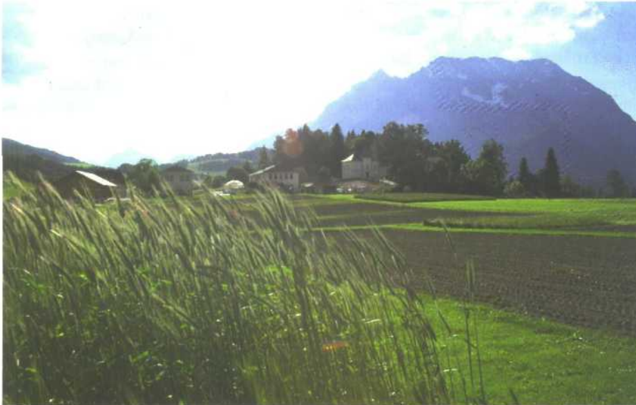
Roggenfeld nach der Blüte im steirischen Ennstal.

Allerdings wurde diese Pyramide in der Praxis oft falsch verstanden. Eine Regel der Sportlerernährung am Tag vor dem Wettkampf: „so viel Spaghetti wie möglich“ wurde von vielen angewendet, die am nächsten Tag keinen Wettkampf hatten. Auch die „Pudding und Torten“-Vegetarier folgten in den Mühen des Alltags schließlich nur einer Bequemlichkeitsdiät. In vielen feinen Backwaren findet sich besonders viel verstecktes Fett. Rezepturen von Schwarzbrot und rustikalem Gebäck mit dunklen Malzmehlen täuschen dem Konsumenten ballaststoffreichere Brote vor. Gefragt wären allerdings gute Brote, die sich ihren Platz an der Basis der Pyramide auch wirklich verdienen.