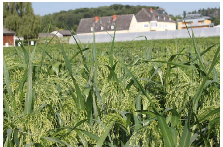
Abb. 3: Kornberger Rispenhirse in der Zuchtstation der Saatzucht Gleisdorf

Von der Saatzucht Gleisdorf in der Steiermark wird die Sorte Mittelfrühe Kornberger Rispenhirse erfolgreich gezüchtet, deren Zulassung als Sorte bereits schon 1950 erfolgte. Die Sorte geht aus einer größeren Hirsesammlung von Schloss Kornberg zurück, die bei Gründung der Saatzucht Gleisdorf nach dem Zweiten Weltkrieg übernommen wurde. Von dieser Sorte gab es eine Saatgutvermehrungsfläche von 76 ha im Jahr 2015 und 35 ha im Jahr 2016. Sie ist in Österreich die am meisten verbreitete und am besten eingeführte Rispenhirsesorte. Zu einem kleinen Teil wird eine Sorte mit Anthocyan in der Rispe angebaut, die schon im Jahr 1988 mit dem Sortennamen Lisa angemeldet wurde [6].