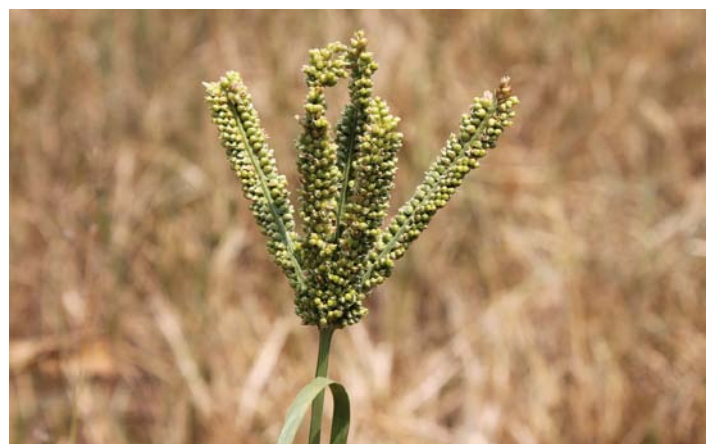
Abb. 2: Finger-Hirse ( Eleusine coracana ), aufgenommen in Mbarara/Uganda

Um den Äquator in Ostafrika ist die wichtigste Hirse die Fingerhirse ( Eleusine coracana ). Die Ährchen sind alle in Ähren zusammengefasst, von denen es etwa 5 bis 10 gibt und sie sehen aus wie eine nach oben gestreckte Hand mit Fingern. Die Hirsekörner sind meist ziegelrot und die Hirse ist vom Geschmack her sehr fein. Ursprünglich aus Afrika, auf Suaheli „wimbi“, ist sie heute als „ragi“ eine bedeutende Hirse in Indien und züchterisch gut bearbeitet.