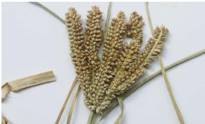
Abb. 8: Ährenstand der Finger-Hirse ( Eriosema coracana ), aus Herbarbeleg/Uganda

Hirse von Bedeutung. Hirsemehl aus Goldhirse wird vor allem für den Einsatz in Broten und einigen anderen Lebensmitteln hergestellt. Bei Hirseprodukten (besonders bei Mehl und Flocken) ist die Haltbarkeit zu beachten, weil die Hirse bei Luftkontakt und warmer Aufbewahrung relativ schnell ranzig werden kann“ [15].