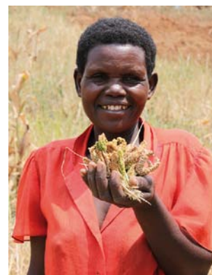
Abb. 11: Fingerhirse ist ein wichtiges Grundnahrungsmittel in Uganda.

Die Fingerhirse wird in Uganda vor allem in kleinbäuerlicher Struktur angebaut, von Völkern, die Rinder halten. Um den Viktoriasee herum gibt es das Kochbanane-Kaffee-Agrarsystem, in dem die Fingerhirse naturgemäß eine geringere Rolle spielt.