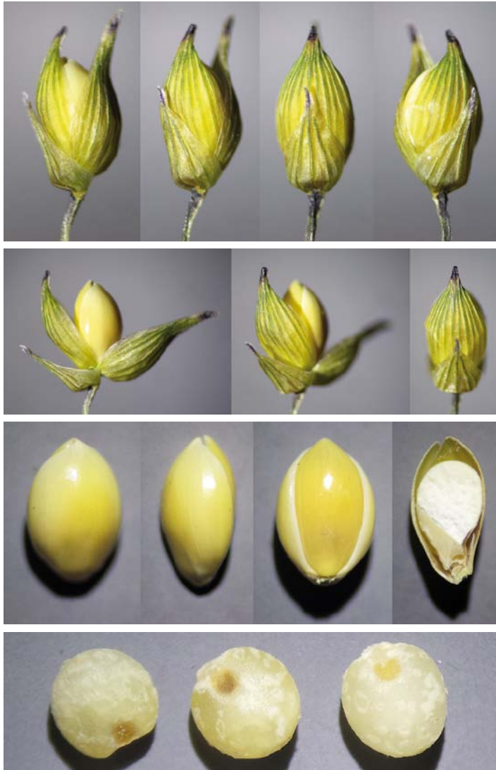
Abb. 7: Die Herstellungsstufen der Rispenhirse vom Feld zur „Goldhirse“ obere zwei Reihen: Ährchen der Rispenhirse mit grün geadernten Hüllspelzen, Mitte: Rispenhirse-Körner vom Mähdrescher in Vor- und Deckspelze, unten: Hirsekörner geschält (genauer entspelzt), im Handel als „Goldhirse“

Hirse von Bedeutung. Hirsemehl aus Goldhirse wird vor allem für den Einsatz in Broten und einigen anderen Lebensmitteln hergestellt. Bei Hirseprodukten (besonders bei Mehl und Flocken) ist die Haltbarkeit zu beachten, weil die Hirse bei Luftkontakt und warmer Aufbewahrung relativ schnell ranzig werden kann“ [15].