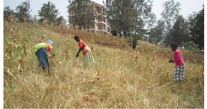
Abb. 9: Das Abschneiden der Ähren von Fingerhirse ist Handarbeit.

Die Fingerhirse ( Eleusine coracana ) ist die wichtigste Hirse in Ostafrika und hat in Uganda, im Sudan und in Äthiopien ihr Entstehungszentrum. Von dort hat sie sich schon früh als Getreide von Ost- bis nach Südafrika und entlang der afrikanischen Küste sowie bis auf die Arabische Halbinsel und nach Indien und Sri Lanka verbreitet, wo sie heute gut eingeführt ist.