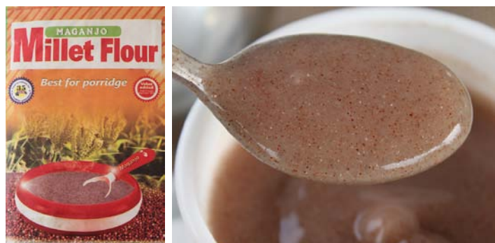
Abb. 12 und Abb. 13: „Millet Flour“ ist ein Grundnahrungsmittel für „porridge“ und „bushera“

Das aus der Fingerhirse hergestellte Mehl wird mit Milch oder Wasser zu einem sehr dicken Brei gekocht, der getrocknet wird und der als Hirsebrot („millet bread“) oder „kalo“ konsumiert wird. Dieses nahrhafte Lebensmittel wird traditionell in sehr schönen Körben aufbewahrt. Die Beilage zu Speisen, heute oft durch Maisgrieß ersetzt, ähnlich wie bei uns Polenta, heißt „ugali“. Mit etwas mehr Flüssigkeit kann man mit Fingerhirse ein „porridge“ bereiten oder sogar ein nahrhaftes Getränk, das an Trinkkakao erinnert. Die Farbe der Hirse ist ziegelrot und gemälzt wird das Getränk daraus süß. Es wird als „bushera“ bezeichnet.