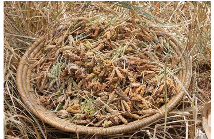
Abb. 10: Die geerntete Hirse wird in einem Korb gesammelt.

Die Fingerhirse wird in Uganda vor allem in kleinbäuerlicher Struktur angebaut, von Völkern, die Rinder halten. Um den Viktoriasee herum gibt es das Kochbanane-Kaffee-Agrarsystem, in dem die Fingerhirse naturgemäß eine geringere Rolle spielt.