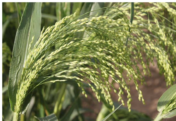
Abb. 1: Rispen-Hirse ( Panicum miliaceum ), aufgenommen bei der Saatzucht Gleisdorf

Die Rispenhirse ( Panicum miliaceum ) ist in Österreich seit der Jungsteinzeit ein Grundnahrungsmittel. Besonders häufig kommt sie in den Quellen des Mittelalters vor, wo oft die Bezeichnungen „Hirs“, manchmal auch „Hirsch“ oder „Brein“ verwendet werden. Der Name bezieht sich auf die Rispe, d. h. die Ährchen liegen an verzweigten Ästen – wie der Reis oder Hafer ist sie ein Rispengras. In der englischen und wissenschaftlichen Literatur wird der aus den slawischen Sprachen übernommene Ausdruck „proso millet“ gebraucht. Als häufigste Hirse in Europa heißt sie auch „common millet“. Die gut gereinigte und geschälte Rispenhirse kommt mit der Warenbezeichnung „Goldhirse“ in den Handel und ist die wichtigste Hirse für österreichi-